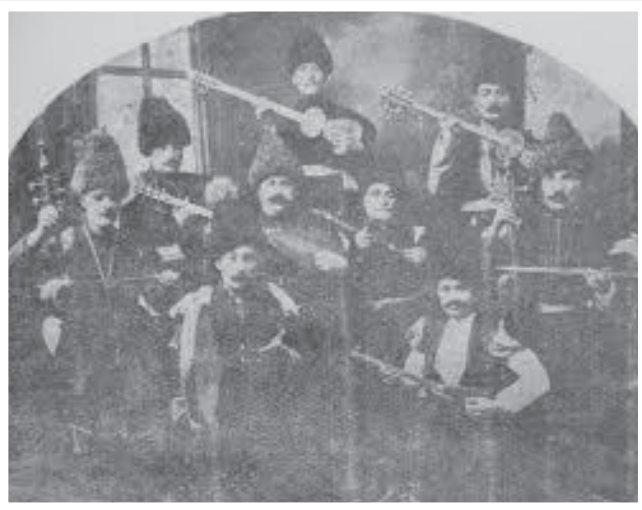
Qədim Tiflisen aşıqlarından biri Haziranın dəstəsi